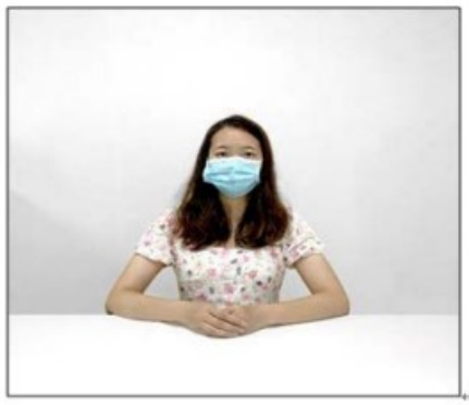
图2：正前方第一机位效果图。