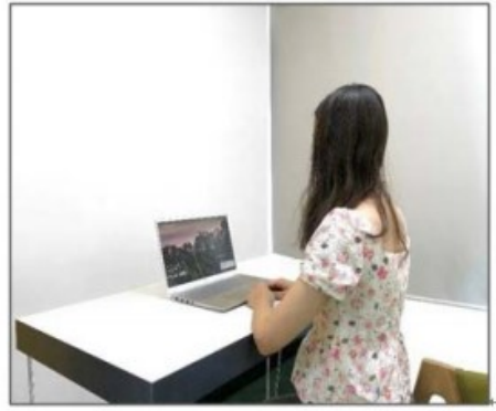
图3：侧后方第二机位效果图。

第二机位设备仅用于监测考试环境，请保证其不会对复试造成干扰。手机作为第二机位“加入会议”后，在“更多”界面“断开音频”，避免多设备啸叫，如下图所示：